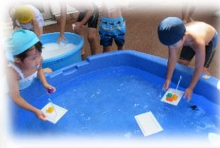
船に宝を乗せてみよう！