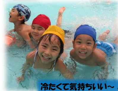
冷たくて気持ちいい～！

晴れた日には、プールでの水遊びをたくさん楽しむことができました。水やフープのトンネルをくぐったり、水面から顔だけ出してワニ歩きをして水の心地良さを感じる姿や、宝探しを楽しむ姿がありました。また、バケツいっぱい泡を集め、泡の感触を楽しむなど夏ならではの遊びを満喫することができました。